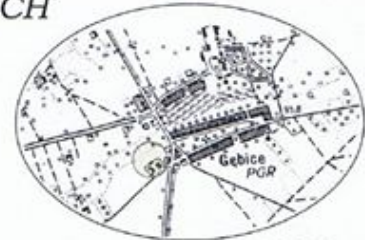
Szkic orientacyjny w skali 1 : 25 000