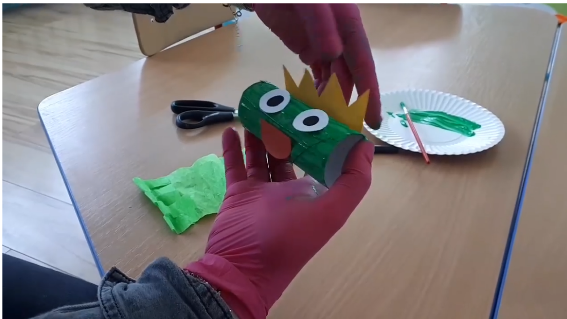
Prace praktyczne w Prywatnym Przedszkolu "Mali Odkrywcy" w Gębicach.

Obecnie, mimo stopniowego uwalniania restrykcji wynikaj?cych ze stanu epidemii w Polsce, szkoły nadal pozostaj? zamkni?te dla uczniów. Te placówki kontynuowały b?d? swój? zdaln? dzia?alno?? w taki sposób, jak to by?o do tej pory. Cz??ciowej zmianie uległo natomiast funkcjonowanie publicznych przedszkoli, które od 18 maja z zachowaniem zalece? sanitarnych, przyjmują dzieci, których rodzice si? na to zdecydowali. Mimo trudno?ci, które dotychczas