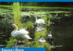
Fauna i flora