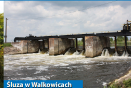
Służa w Walkowicach