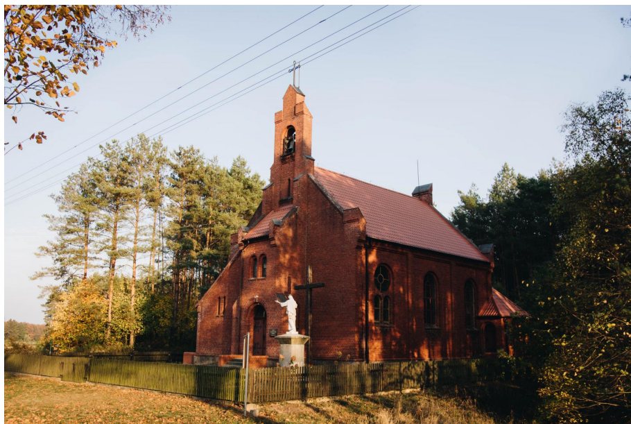
Kościół pw. Chrystusa Króla wybudowany w stylu neogotyckim.